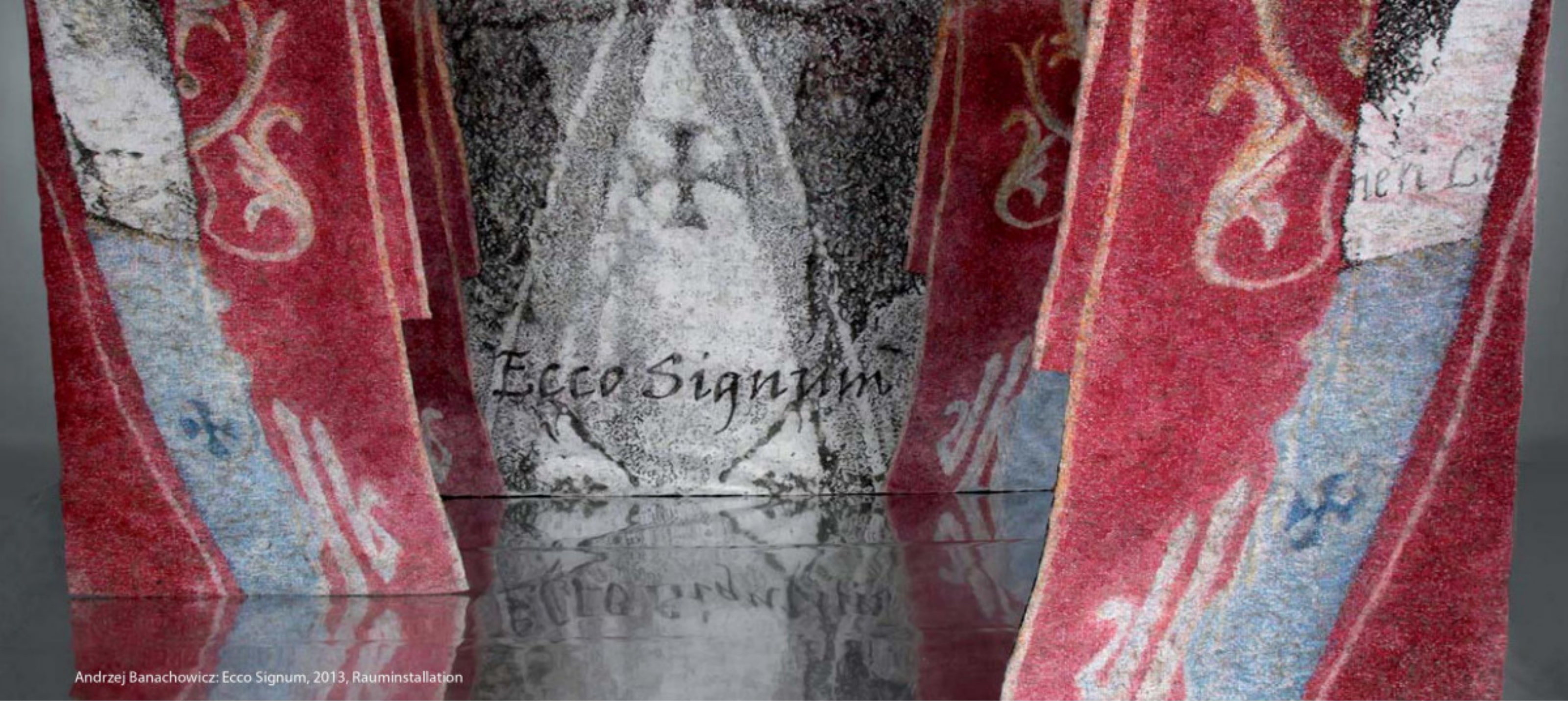
Andrzej Banachowicz: Ecco Signum, 2013, Rauminstallation